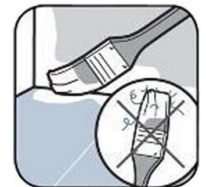
Non Rilascia Residui